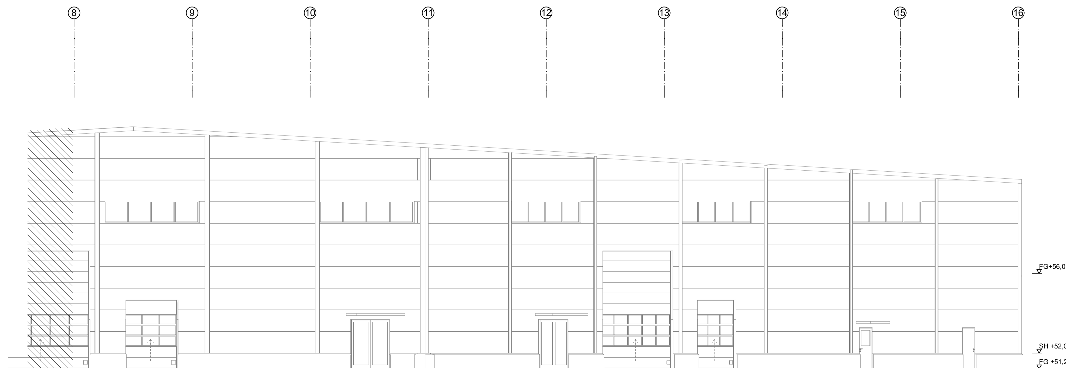
A2 FASAD MOT ÖSTER 1:100